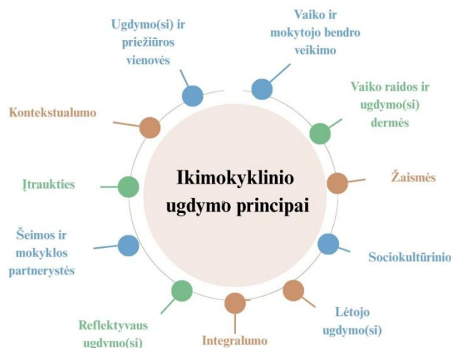
3 paveikslas. Ikimokyklinio ugdymo principai

Programa parengta vadovaujantis svarbiausiais ikimokyklinio ugdymo principais, užtikrinančiais ugdymo(si) kryptingumą, integralumą, veiksmingas ugdomasias sąveikas ir ugdymo(si) kokybę (Žr. 3 paveikslą):