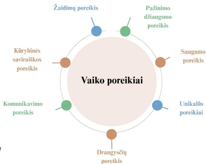
2 paveikslas. Vaikų

Mūsų įstaigos ugdymo aplinka bei pedagogų darbas orientuotas į tai, kad kiekvienas vaikas jaustųsi orus, matomas, girdimas ir reikšmingas. „Kaip miške“ darželyje tenkinami ir turtinami kiekvienam vaikui aktualūs poreikiai (Žr. 2 paveikslą)