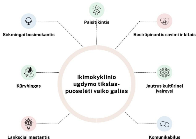
4 paveikslas: Vaiko galios

Ikimokyklinio ugdymo tikslas – atsižvelgiant į vaikų prigimtines galias, patirtį, poreikius, šeimos ir bendruomenės susitarimus, kurti lanksčius edukacinius kontekstus, įgalinančius vaikus išsiugdyti pasitikėjimo, rūpinimosi savimi ir kitais, kultūrinio ir socialinio jautrumo, komunikavimo, lankstaus mąstymo, kūrybiškumo, mokėjimo mokytis pradmenis (Žr. 4 paveikslą):