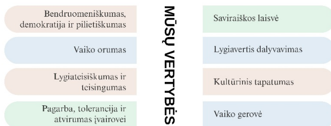
1 paveikslas. Mūsų vertybės

“Kaip miške” ugdymo įstaigoje visas ugdymas ir ugdymasis grindžiamas požiūriu į vaiką ir vaiko ugdymą(si) sąlygotomis vertybėmis (Žr. 1 paveikslą):