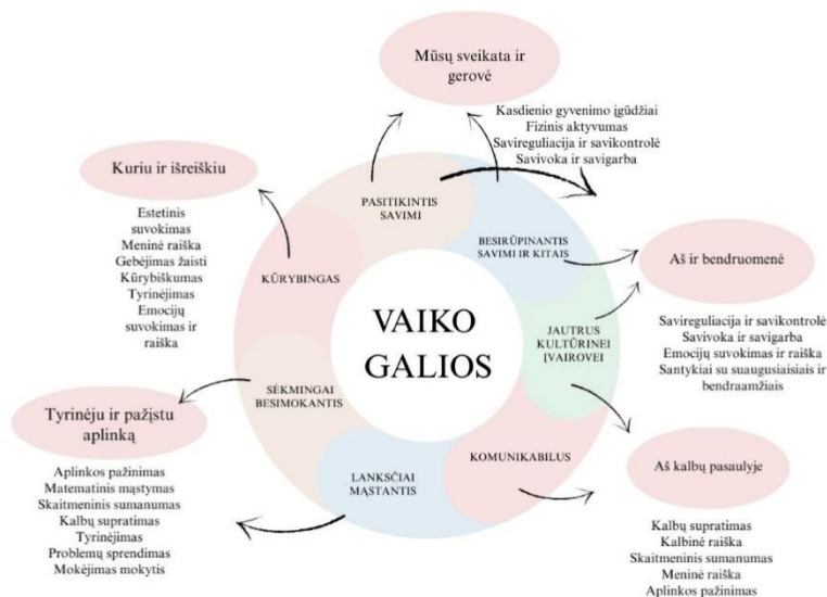
6 paveikslas. Ikimokyklinio amžiaus vaikų pasiekimų sritys.

Ankstyvojo ir ikimokyklinio amžiaus vaikų ugdymo(si) turinys sudarytas remiantis Ikimokyklinio ugdymo programos gairėmis (2023) , atskleidžiant plėtojamas vaiko galias per svarbiausias ugdymo(si) sritis ir jas apimančias pasiekimų sritis (Žr. 6 paveikslą).